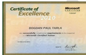
Microsoft Certified Trainer (2001 -prezent)