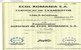
Instructor ECDL (din anul 2003)