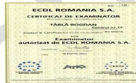
Instructor ECDL (din anul 2003)