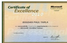
Microsoft Certified Trainer (2001 - prezent)