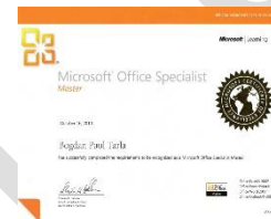
Microsoft Office Instructor