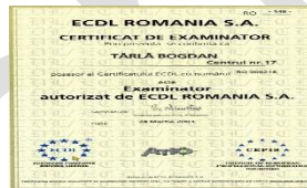
Instructor ECDL (din anul 2003)